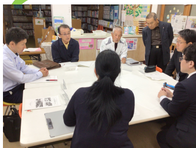
【2グループに分かれての熟議】