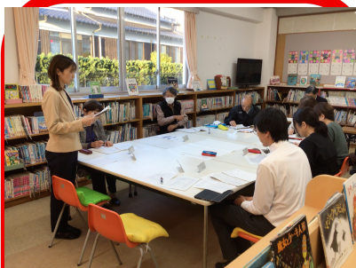
【各部会からの報告】

今回出た意見を大事にして、これからも児童の主体性を引き出すための方策を考えていきたいと思います。