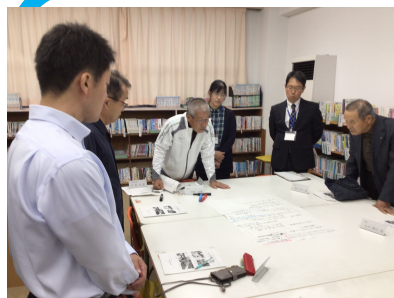
【熟議した内容の共有】